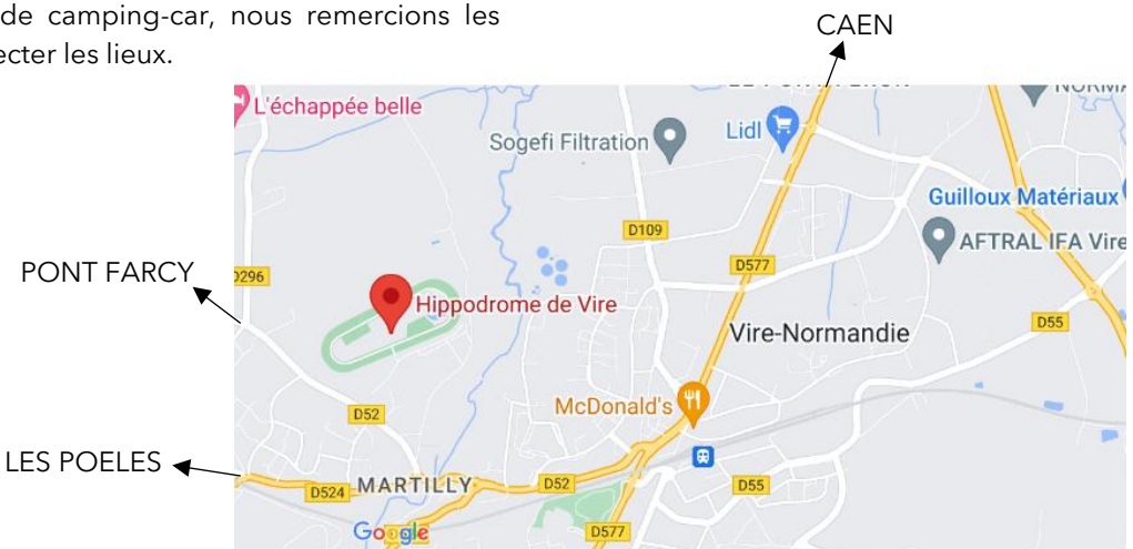
Centre-ville de VIRE

Un parking camping-car est prévu à l'hippodrome Robert Auvray à Vire . Il s'agit d'un parking classique et non d'une aire de camping-car, nous remercions les usagers de respecter les lieux.